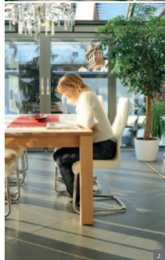
Cover: Fotomontage CONMA Werbeagentur GmbH